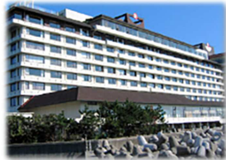
● 三日月シーパークホテル安房鴨川

健康保険、厚生年金保険、雇用保険、労災保険、 労働災害総合保険、確定拠出年金(401K) 建設業退職金共済、財形貯蓄等に参加 他に退職金制度あり 〔休日〕 土曜日、日曜日、祝日（完全週休2日制） 夏季休暇（3日間）、年末年始休暇（12月30日 ～1月4日の6日間） ※有給休暇推奨日および 特別目的積立休暇制度あり