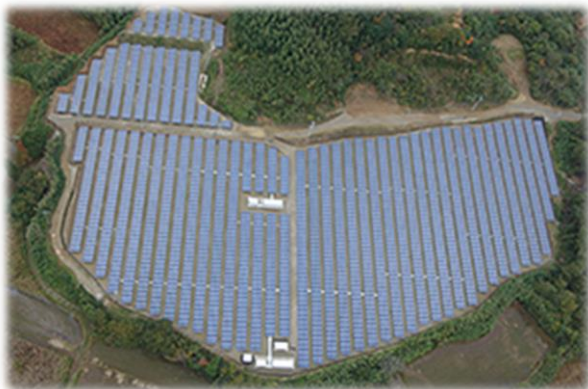
● 潮来新宮太陽光発電所設置工事