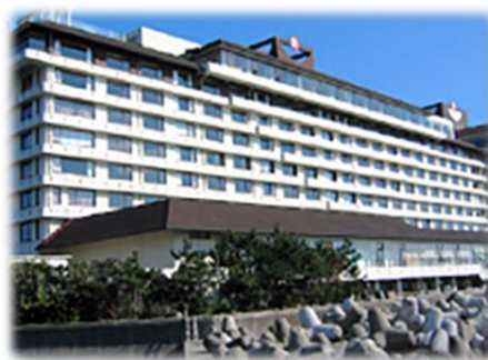
● 小湊ホテル三日月

夏季休暇（3日間）、年末年始休暇（12月30日～ 1月4日の6日間） ※有給休暇奨励日あり